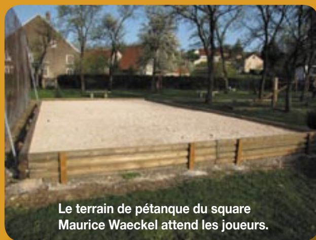
Le terrain de pétanque du square Maurice Waeckel attend les joueurs.

Ces interdictions portent également sur l'usage des eaux du réseau public et l'usage des eaux superficielles, eaux de sources ou nappes ou puits. Elle ne s'applique pas à l'utilisation des réserves artificielles constituées préalablement à cet arrêté. Cet arrêté prend effet à la date de signature pour une durée de trois mois, il pourra être abrogé, prolongé ou modifié. Se référer à l'affichage municipal.