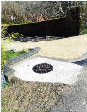
Impasse des Perrières - Rue du Martelet