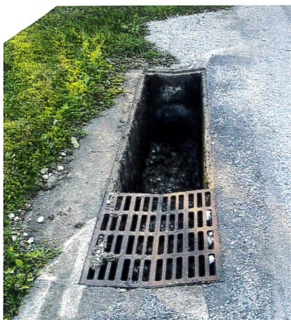
Vol de trois grilles d'eau pluviales le 18 août 2024

https://www.fftelecoms.org/categories/fin-du-cuivre